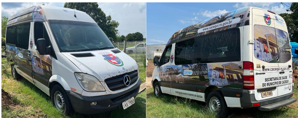
Lote 10 e 11.